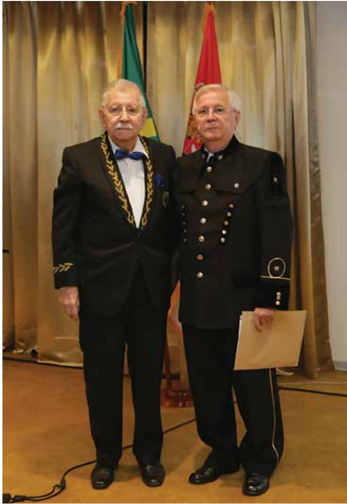
Београд, 28. септембар 2022, VIII Балакански рударски конгрес