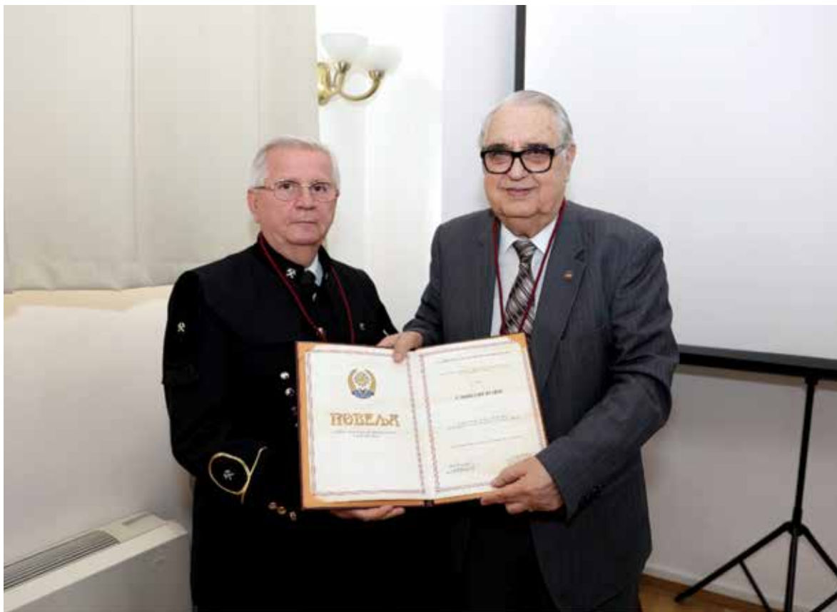
Бања Лука, 17. мај 2022, Академија наука и умјетности Републике Српске уручење Повеле о избору за иностраног члана, председник академик Рајко Кузмановић