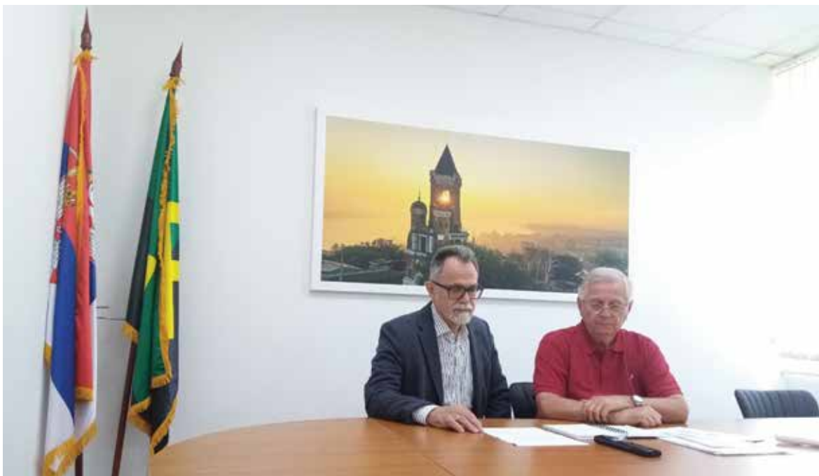
Београд, 15. септембар 2022, Рударски институт, консултације