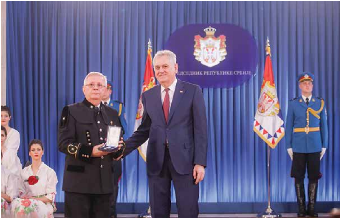
Београд, 15. фебруар 2017, Председништво Републике Србије уручење Сребрне медаље за изузетне заслуге и постигнуте научне резултате у областима рударства и геологије, председник Томислав Николић