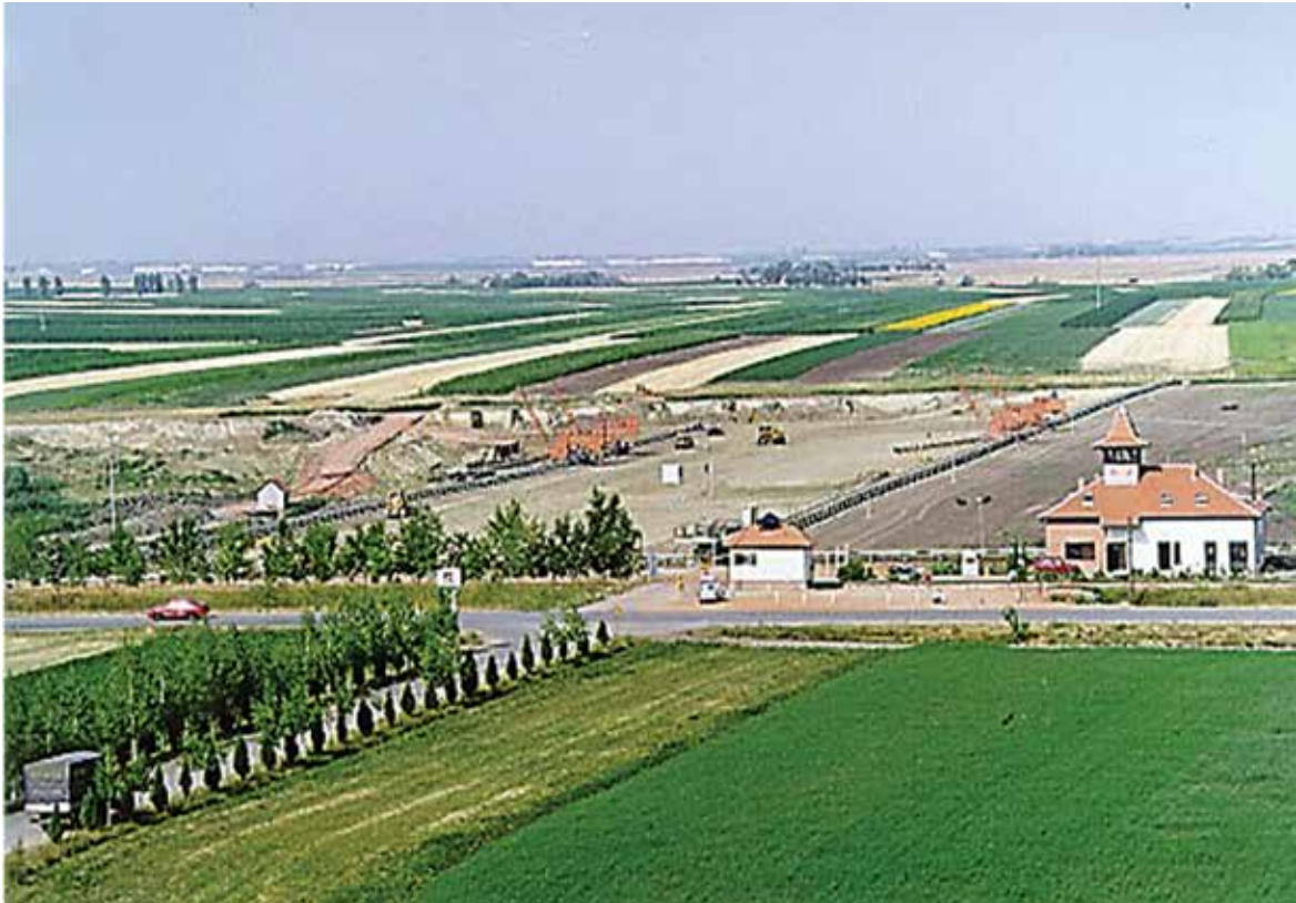
Површински коп Мајдан III, јули 2000, панорама

Крајем те несрећне деценије пројектно решење је не само потпуно реализовано већ и унапређено увођењем даљинског рачунарски подржаног система надзора и управљања БТО (багер–трака–одлагач) комплексом. На професоров предлог купљени су у Колубари транспортери искључени из производње и одлагач са депоније угља Термоелктарне Костолац А, такође ван употребе. Опрема је ремонтована и делимично реконструисана у Колубара металу.