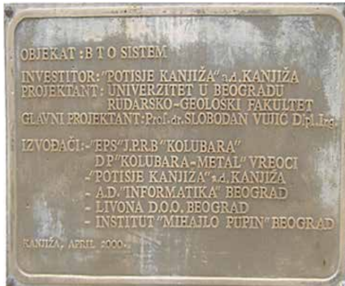
Кањижа, април 2000, Површински коп Мајдан III белег о изградњи БТО система

Научни пројекат истраживање нових технологија, метода и феномена експлоатације и прераде металних и неметалних минералних сировина. Потпројекат: Истраживање и развој мултиваријабилних инжењерско-математичких метода планирања, пројектовања и управљања производним комплексима металних и неметалних минералних сировина. Појекат финасирало Министарство за науку и технологију, 1996-2000.