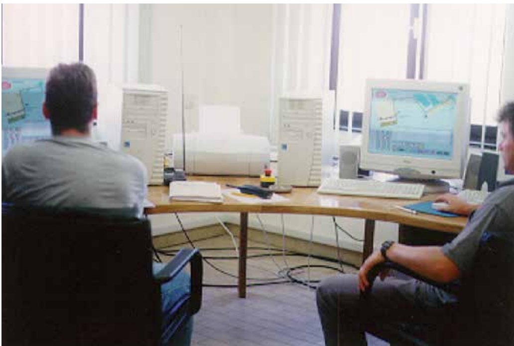
Диспечерски центар Површинског копа глине Мајдан III, 2000.

Подаци прикупљени у диспечерском центру прослеђују се надређеном пословно-информационом систему Потисја, где се формирају базе података. Реализацијом овог система на описани начин постигнуте су вишеструке уштеде: на транспорту минералне сировине, већем временском и ка-