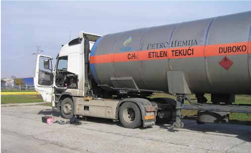
ХИП Петрохемија Панчево, 28. новембар 2007, Уградња експерименталне GPS опреме у камион-цистерну Volvo FH12 460

са факултета) који су у излагањима радова показивали да методе или нису добро разумели или их нису коректно применили. Импровизације нису пролазиле нити их је прихватао, одлучно и аргументовано је указивао на пропусте, покретао расправу и иницирао дискусију.