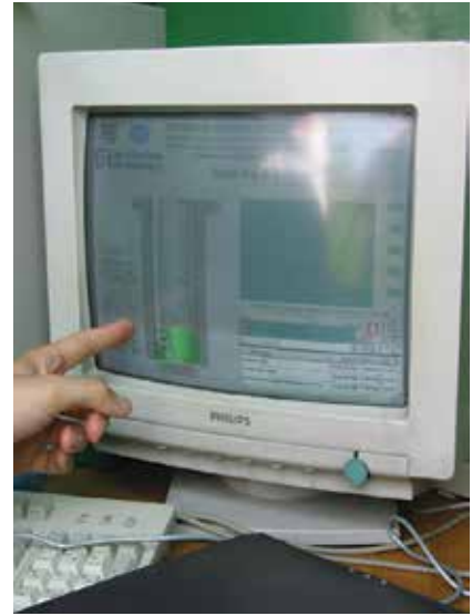
Костолац, Површински коп Дрмно, април 2004, монтажа и тестирање опреме за експериментална истраживања на бунару PLB-II-5 даљинског надзора и управљања одводњавањем рудника