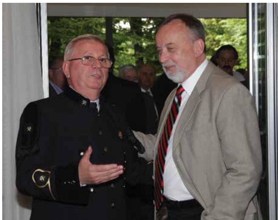
Београд, 28. мај 2013, на свечаности у Клубу посланика поводом уручења повеља „Академик Љубомир Клерић“ и „Проф. др Димитрије Антула“