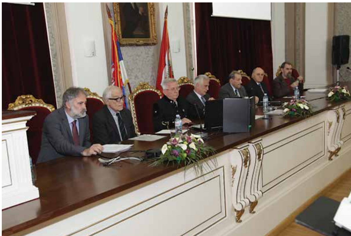
Београд, 28. април 2015, Свечана сала Универзитета у Београду промоција монографије Српско рударство и геологија у другој половини XX века

Докторском дисертацијом на тему Математичко моделирање лежишта минералних сировина у циљу одређивања основних техничко-технолошких параметара површинских копова, одбрањеном 25. априла 1980. на матичном факултету, ушао је у подручје нових истраживања. Научним доприносима, оригиналним математичкомоделским и алгоритамским решењима придружио се пионирској групи водећих истраживача у свету у овој области. Није се задржао само на теоријским резултатима, већ је софтвером који је креирао и сам писао (погледати