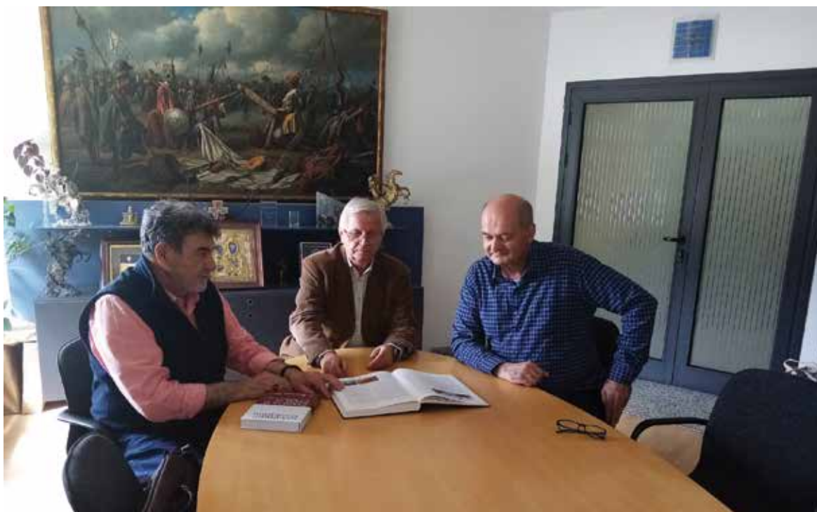
Београд, 19. април 2022, у Информатици

изузетно плодне трајне сарадње. Испоруком опреме у конфигурацији мастер и пет кластер рачунара, меморијска јединица великог капацитета и плотер сарадња је брзо надрасла стандардну пословну форму и закорачила у стручне и истраживачке сфере тек рађајућих рачунарски подржаних рудничких надзорно-управљачких технологија. Индикатори успешности данас су дела по којима нас струка препознаје.