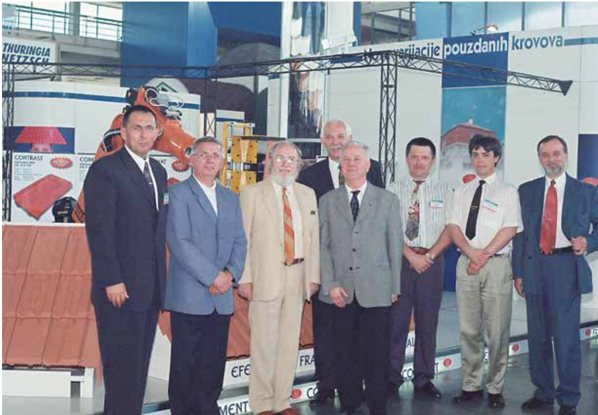
Београд, 2000, Сајам грађевинарства

Посвећеношћу пројекту, сарадницима и харизматичношћу којом нас је освајао стварао