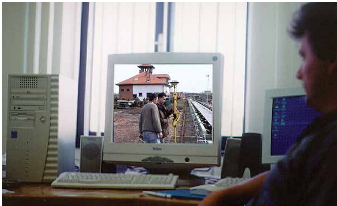
Кањижа, 2001, Површински коп Мајдан III, прва примена GPS телеметрије на рудницима ове класе у свету, за позиционирање и навигацију машина у реалном времену и геодетски премер

Временом су GPS пријемници постајали мањи, лакши, мањи потрошачи енергије, практичнији, могли су да се уграђују било где. Могли су да полете. Историја се поно-