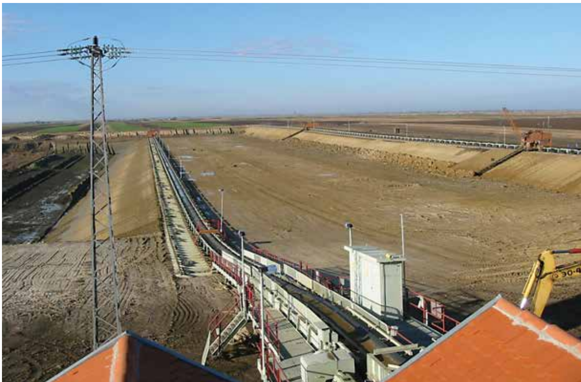
Површински коп Мајдан III, 20. новембар 2002.

Дрмно Костолац, Јазовник, Колубара Грађевинар Лазаревац) поставио је логичко-тополошке стандарде у овој области рударства (Европска конференција „Lignite Innovations for Future in Europe”, Freiberg, 2000). Увођењем ових система остварене су бројне конкретне користи. У овој групи резултата издваја се рачунарски надзорно-управљачки систем БТО комплекса површинског копа Мајдан III Потисја из Кањиже. Изграђен пре 20 година према пројекту и под руководством Слободана, први такав систем у свету, концепцијски до данас није превазиђен.