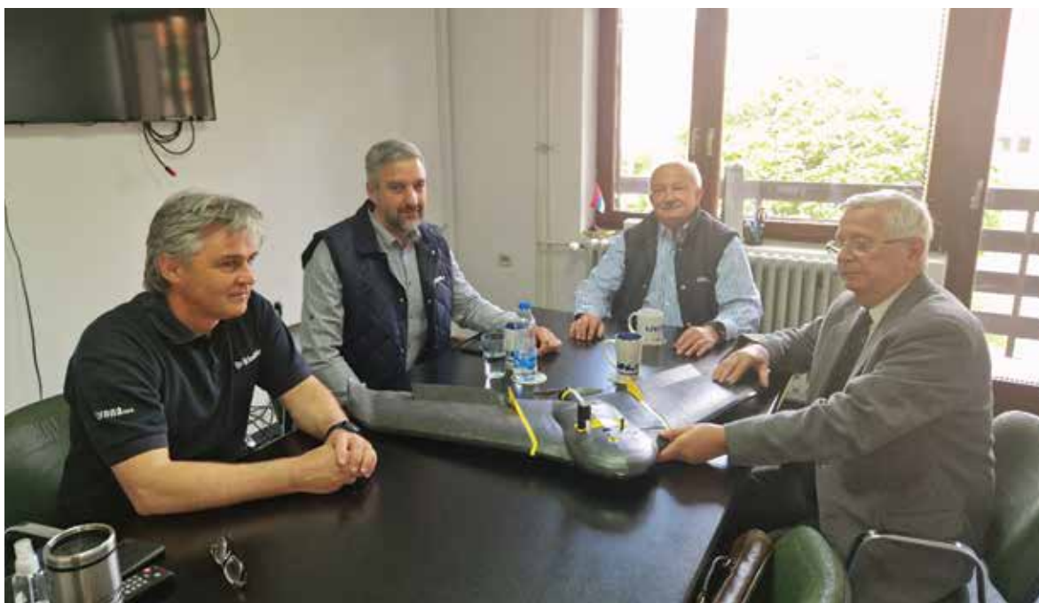
Београд, 17. мај 2022, Ливона, прва беспилотна летилица примењена у аерофотограметријском снимању површинских копова у Србији

Прва међународна конференција посвећена GPS технологији под мотом „GPS је стигао”